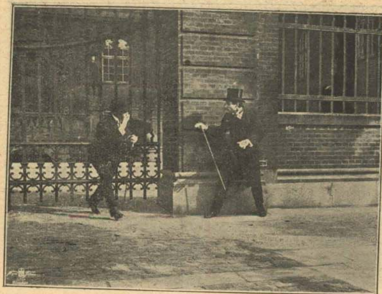
Med uforrettet Sag.

som har opdaget Nevills Sindsbevægelse, lister sig efter ham, og han ser nu, at Newill gaar udenfor sin Bolig og der mødes