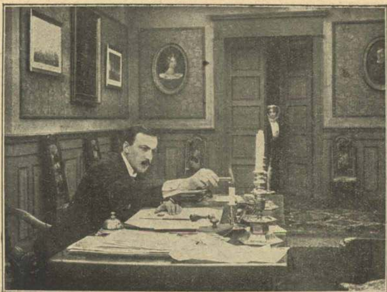
I en sen Time.

med en lurvetklædt Mand. Han ser, at Direktøren giver Manden Penge og sørger for skyndsomst at faa ham afsted.